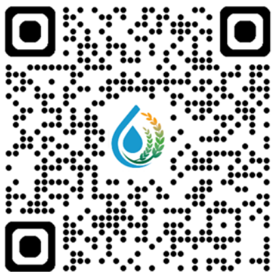
公版資料夾與命名說明連結 Qrcode